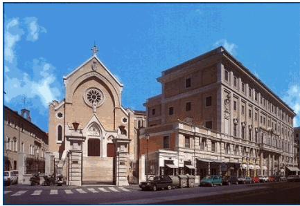
Die St. Alfons Liguori - Kirche

Die Ikone der Muttergottes von der Immerwährenden Hilfe kam um 1499 in die St. Matthäus-Kirche. Ein späterer Chronist schrieb über die Kirche: „Darin gab es ein altes Bild von der Jungfrau Maria, sehr geehrt und durch die Wunder bekannt.“ Die wunderbare Periode dauerte ungefähr 300 Jahre bis zur Französischen Revolution, als Napoleons Truppen nicht weniger als 40 Kirchen in Rom zerstörten. Das Bild wurde gerade noch gerettet und versteckt, und die Kirche selbst, auf deren Giebel die Worte: „Unserer Lieben Frau von der Immerwährenden Hilfe und dem Apostel und Evangelisten St. Matthäus“ standen, wurde durch die Armee Napoleons dem Boden gleichgemacht.