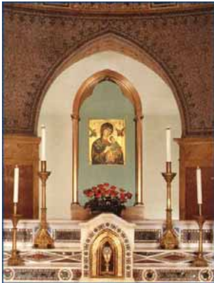
Der Hauptaltar mit dem Bild der M.v.I.H.