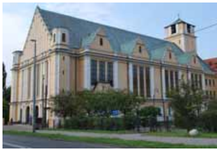
Die St. Joseph - Kirche