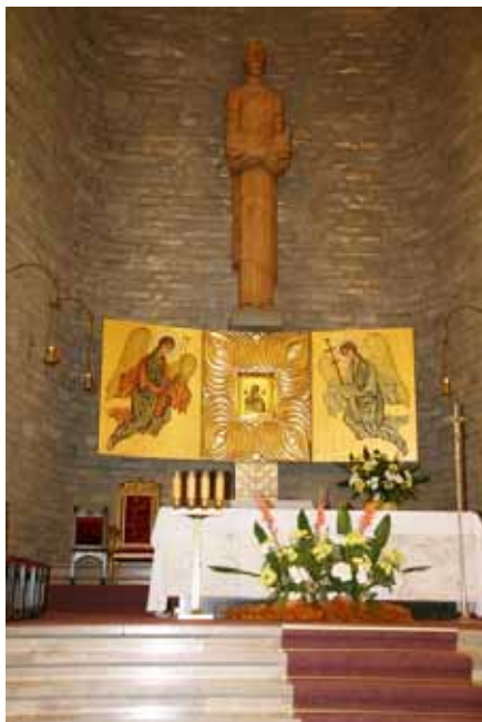
Der Hauptaltar mit dem Bild der M.v.I.H.

Nach dem Krieg kehrten die Redemptoristen in das verwüstete und noch durch die sowjeti-schen Truppen besetzte Kloster in Bielany zurück. Im März 1945 wurde das Gnadenbild feierlich in die aufgeräumte Kirche übertragen und im Altar angebracht. Das Jahr 1947 brachte eine große Wiederbelebung des Kultes von der Jungfrau Maria mit sich. Am 22. Juni wurde die Bildkrönung der Ikone wieder feierlich angeordnet. Trotz ihrer Größe behielten die Feierlichkeiten einen lokalen, sogar fast einen privaten Charakter. Weder ein Priester noch ein Vertreter der Diözesankurie waren dabei. Nach einem Gottesdienst, der im Kirchhof abgehalten worden war, ging die feierliche Prozession mit dem Bild durch die Straßen der Stadt. Die Feierlichkeiten fanden in den kommenden Jahren bis zum Jahre 1961 statt, als die kommunistischen Behörden die Prozessionen verboten.