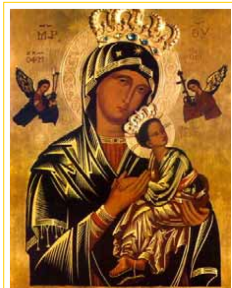
Die Ikone der Muttergottes von der Immerwährenden Hilfe

Kurz vor seinem Tod vertraute der diebische Kaufmann seinem Freund das Bild an, damit er dieses Bild einer Kirche in der Stadt übergebe, damit das Gemälde vielen Menschen dienen konnte. Der Freund behielt aber das Bild für sich selbst, bis auch er das Ende seines Lebens erreicht hatte. Einige Male erschien nun die Jungfrau Maria im Traum seiner kleinen Tochter und äußerte den Wunsch, dass ihr Bild in der Kirche zwischen den Basiliken von Santa Maria Maggiore und St. Johannes im Lateran angebracht werde. Letzten Endes übergab die Frau des Besitzers das Bild der St. Matthäus-Kirche in Rom.